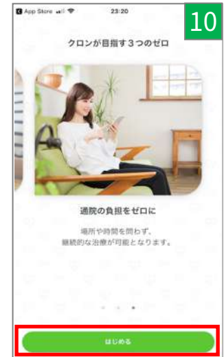
「はじめる」をタップし、 インストール完了！ ログイン画面へ進む