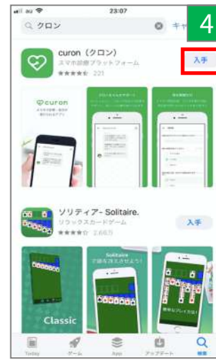
「入手」をタップ、 読み込み開始