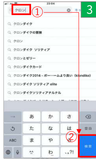
①「クロン」と入力し、 ②「検索」をタップ